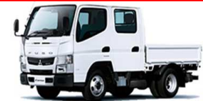
教習車例: 準中型車